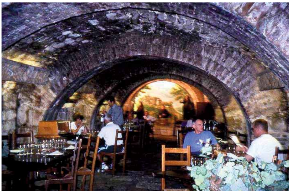
U podrumima nastalim od rudnika vapnenca: izložbeni dio, i elegantno uređeni restoran

Prethodno postojanju samostana, prostor bio je rudnik vapnenca i predstavljao je glavni izvor materijala za izgradnju jezgre grada. U zidovima muzejskih galerija fosilizirani ostaci što upućuju na postojanje rudnika lijepo su vidljivi. Na brežuljcima Chaillot, u blizini današnje ulice Vineuse (VINSKA ulica), svećenici su uzgajali vinovu lozu na nekoliko jutara zemlje. U njihovom ružičastom vinu uživao bi kralj Louis XIII po povratku iz lova u Bulonjskoj šumi.