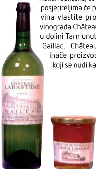
Na kraju obilaska muzeja, domaćini nude čašu vina Château Labastidie, vlastite produkcije

Nakon obilaska, osoblje muzeja posjetiteljima će ponuditi čašu vina vlastite proizvodnje iz vinograda Château Labastidie u dolini Tarn unutar apelacije Gaillac. Château Labastidie inače proizvodi i pekmez koji se nudi kao suvenir. 🍷