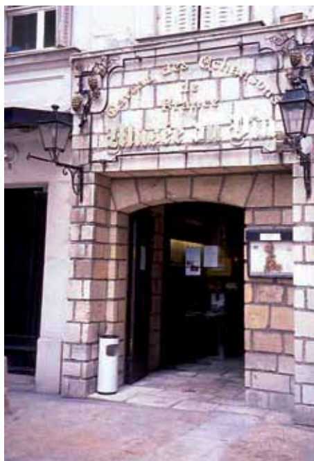
Muzej vina u Parizu: ulaz