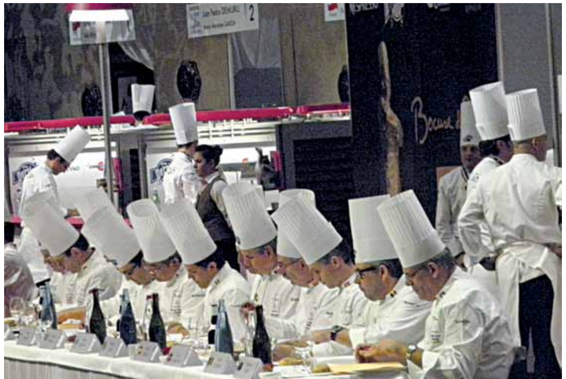
Što se bijeli u gori zeleno... S natjecanja Bocuse d'Or

Među brojnim popratnim manifestacijama i prezentacijama izdvojit ćemo, naslovima, neke koje svakako mogu jako zanimati hrvatske ponuđače: Osnove poticanja potrošnje vina u cateringu , pa Vino, kultura, vinski turizam, trening i događanja , Vino i čokolada – novi trendovi sljublivanja , Vino na čašu: ključne razlike među restoranima . Nije izostala ni zanimljiva radionica pod nazivom Sljublivanje