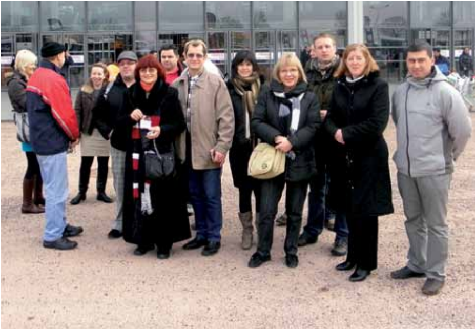
Hrvatski kuhinari u posjetu sajmu SIRHA i natjecanju Bocuse d'Or

Kao što je uobičajeno na ovakvim izložbama, podijeljene su i nagrade, jer zadatak SIRHA-e je promicanje inovacija i kreativnosti na svim područjima vezanih uz hranu: od novih proizvoda namijenjenih velikim kuhinjama, do opreme i popratnih djelatnosti. Tako je Grand prix za inovacije dodijeljen kompaniji Cap Diana za njihov proizvod Glacis de légumes (koncentrat biranog povrća), a od ostalih nagrađenih izdvojili bismo neodoljiv svježi sir od kozjeg mlijeka mljekare Rians Restauration. Treba spomenuti i posebno priznanje koje je dodijeljeno kompaniji Lactalis CHF za Roux blanc (temeljac za bešamel umak) marke Président Professionel.