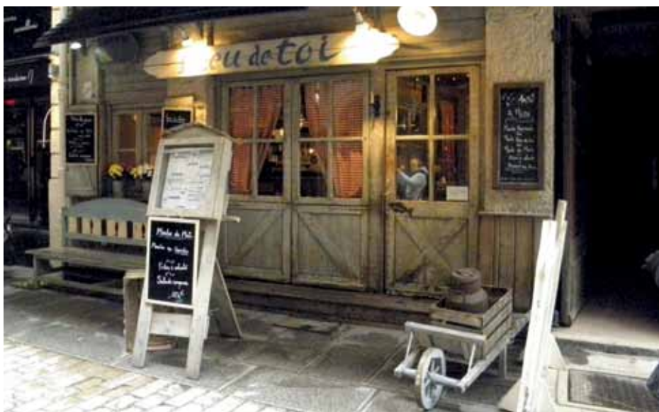
Ulaz u jedan od brojnih malih lionskih specifičnih restorana s domaćim specijalitetima u priredbi Mama (Mères)