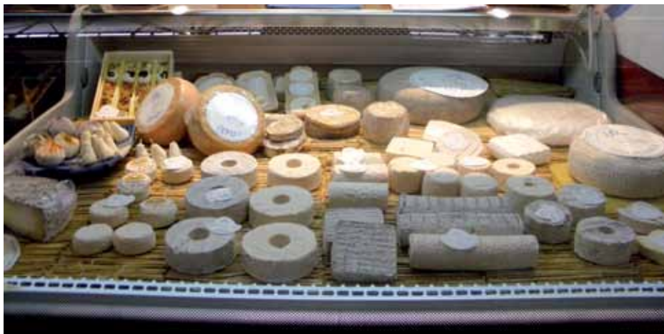
Francusko bogatstvo sireva

Uz jela od peradi iz Bressea, čuveni su i brojni sirevi kao Tomme de Savoie, generički naziv za više vrsta sličnih savojskih sireva od kravljeg mlijeka koje odlikuje niski sadržaj masti, zatim Bleu de Bresse, masni kravljeg sir s plavom plemenitom plijesni, planinski Reblochon, mladenački svježeg i nježnog okusa s tankim slojem plijesni na površini tanke narančasto žute korice, zatim Saint-Marcellin, izvanredni